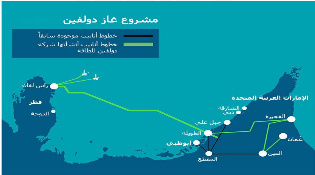
رسم توضيحي لخط غاز الدولفين بين قطر والامارات.

كما شهدت عائدات النفط انخفاض حاداً. مما أدى إلى عرقلة برنامج التكامل الاقتصادي لدول الخليج والذي يشمل مشاريع عملاقة تتعلق بالكهرباء والطرق. فمنذ تأسيس مجلس التعاون الخليجي في عام ١٩٨١م، قطعت الدول الأعضاء في المنظمة شوطاً طويلاً في تعزيز تكاملها الاقتصادي. وقد شمل هذا المخطط أيضاً التدفق الحر لرأس المال بين البلدان والاستثمارات المشتركة في البنية التحتية. أهمها خط أنابيب دولفين للغاز، الذي ينقل الغاز من قطر جنوباً إلى الإمارات العربية المتحدة وإلى عمان، والذي لم يتوقف عن التدفق في ظل الازمة القائمة بين البلدين، مما يدل على أهمية الاعتماد المتبادل بين الدول.